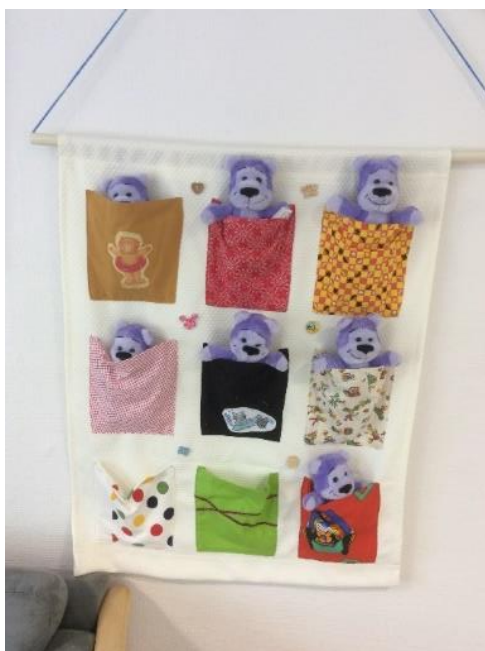
Bamser til "Fri for mobberi"

Forældresamarbejdet omkring barnets sociale udvikling vægtes højt via den daglige dialog og forældresamtaler, fordi det åbner op for en fælles forståelse af barnets perspektiv og sociale liv hjemme og i institutionen, så vi sammen kan understøtte barnets læring og opbygning af indbyrdes relationer og fællesskaber.