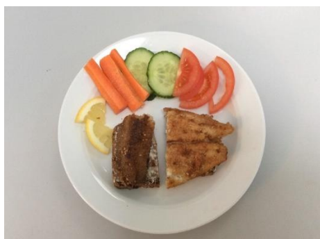
Vi har kommunal frokostordning

Vi har en kommunal frokostordning, hvor vores faste køkkenassistent laver alsidigt mad til alle børn til frokost. Ligeledes får børnene hver dag serveret formiddagsmad og eftermiddagsmad.