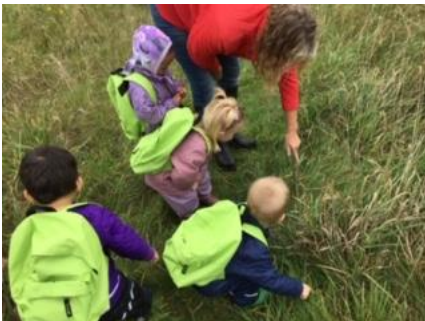
En gruppe vuggestuebørn på tur på udkig efter dyr i den nærliggende natur.

Vi understøtter barnets gå-på-mod i alle situationer med nærvær, opmuntring og guidning, så de får en succesoplevelse, som de vokser af. De voksne står klar til at hjælpe og understøtte, hvis udfordringen bliver for stor.