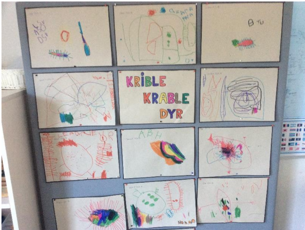
Der arbejdes på forskellig vis med et tema, her "Krible krable dyr".