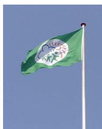
Vi har det grønne flag

Vi går ofte den samme tur, så vi kan se, hvordan naturen ændrer sig, når årstiderne skifter.